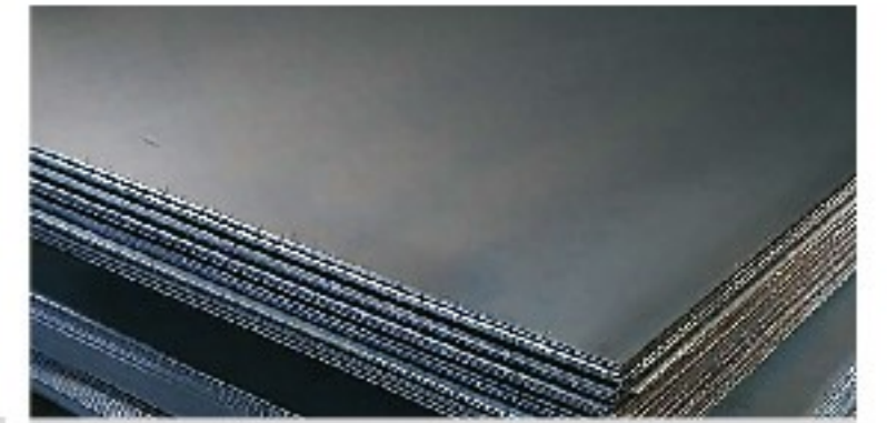
SİYAH, GALVANİZ, DKP SAC