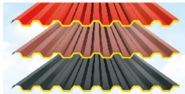
TEK KAT PANEL